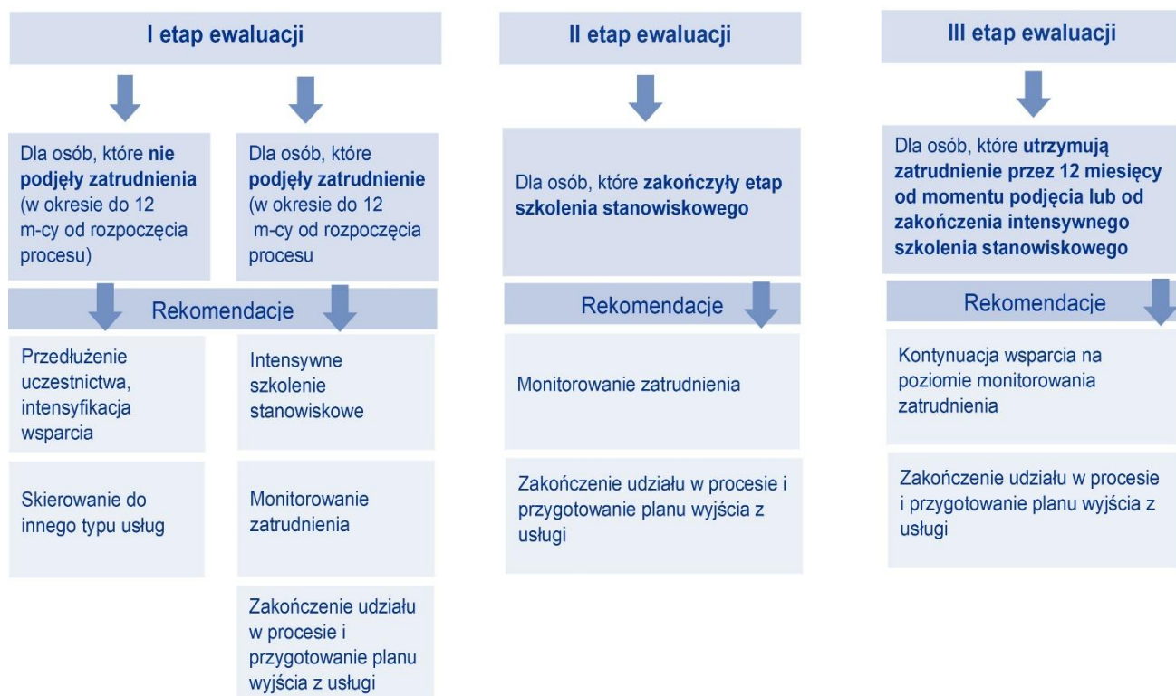
Grafika nr 4 - schemat etapów ewaluacji zatrudnienia

Schemat przedstawia trzy etapy ewaluacji procesu zatrudnienia wspomaganego wraz z grupami uczestników i rekomendacjami dla każdego etapu.